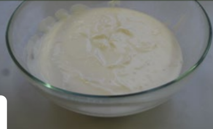
SLADKÁ VARIANTA / SWEET VERSION