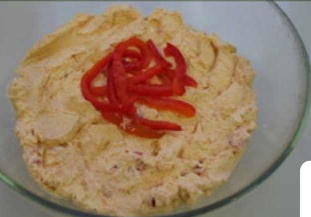
SLANÁ VARIANTA / SALT VERSION

Whip the egg yolks with the sugar and oil. Add the flour mixed with baking powder, milk, and the whipped egg whites. Color a portion of the batter with cocoa. Bake in an oven preheated to 180 °C (356 °F) for 50 minutes.